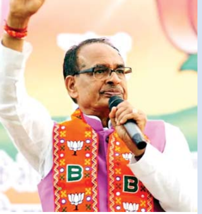
विदिशा ● एजेंसी

अब मामा दिल्ली जाएंगे और दिल्ली भी खाली पीली नहीं जाएंगे